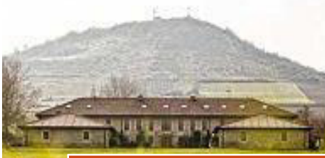
Dehesa etxea Ingurugiro Gaietarako Ikastegia

Olarizu zelaia abiapuntua izango da. Olarizuren izen jatorria, historialarien arabera, Olarizuko parkea dagoen tokian herrixka bat zegoen: 1025 urtean dokumentaturik dago Hollarruizi zuela izena; eta geroago, Hollarruizu izenarekin ere aurkitu dira dokumentuak. Eta azkenik XIX.mendean hartu omen zuen Olharizu izena. San Millango Errejan agertzen da: “...Gardellihi tres regas, Gaztelli et Meiana tres regas. Mendiolha, Hollarruizu , et